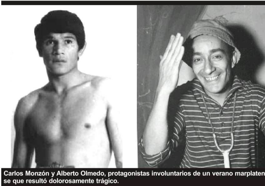
Carlos Monzón y Alberto Olmedo, protagonistas involuntarios de un verano marplatense que resultó dolorosamente trágico.