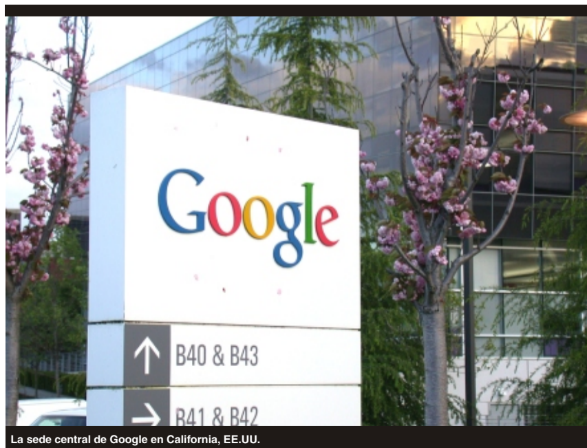
La sede central de Google en California, EE.UU.

Finalmente, ante la posibilidad de que los votos de una consulta popular terminaran con su carrera ganadora, Menem desistió públicamente de su idea de buscar una nueva reelección. Y Duhalde se consolidó como candidato a presidente para las elecciones nacionales.