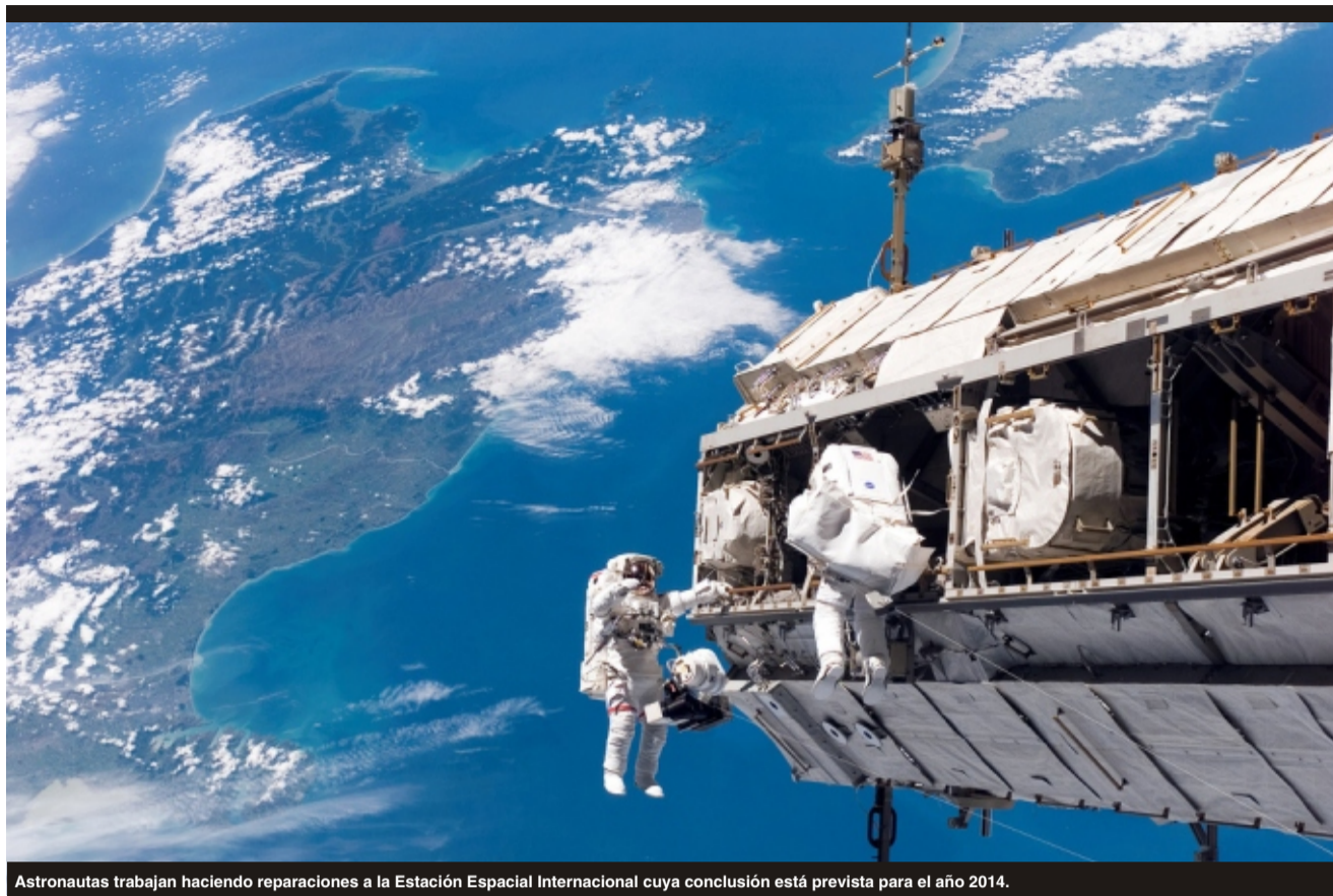
Astronautas trabajan haciendo reparaciones a la Estación Espacial Internacional cuya conclusión está prevista para el año 2014.